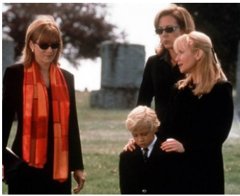
2001 AFFAIRES DE FEMMES (A Girl Thing) de Lee Rose avec Glenna Headly, Allison Janney