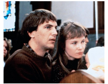
1983 LE DERNIER TESTAMENT (Testament) de Lynne Littman avec Kevin Costner