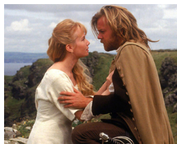
1993 LES TROIS MOUSQUETAIRES (The Three Musketeers) de S. Herk avec Kiefer Sutherland