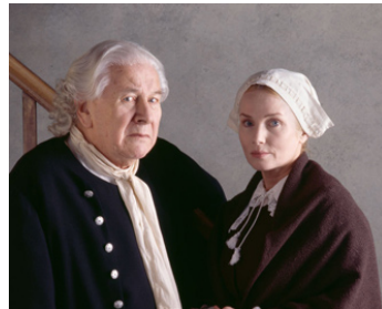
2002 LE PROCÈS DE SALEM (Salem Witch Trials) de Joseph Sargent avec Peter Ustinov