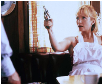
1999 LE PRIX DU DOUTE (A Table for One) de Ron Senkowski