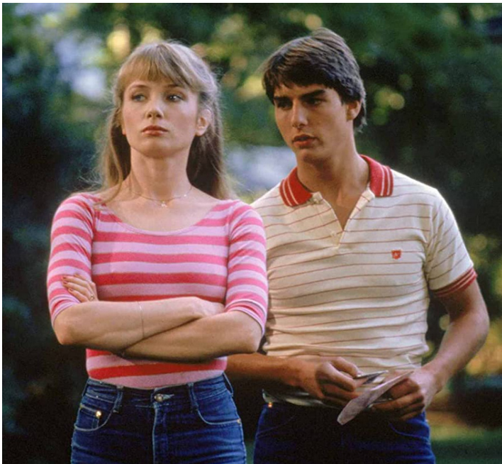
1983 RISKY BUSINESS (Risky Business) de Paul Brickman avec Tom Cruise