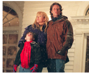
1997 LES COULOIRS DE LA PEUR (The Shining) de Mick Garris avec C. Mead, Steven Weber