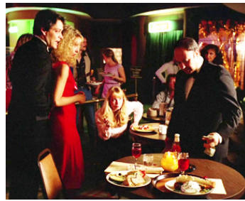
1982 COUP DE CŒUR (One from the Heart) de Francis Ford Coppola avec R. Julia, T. Garr, A. Garfield