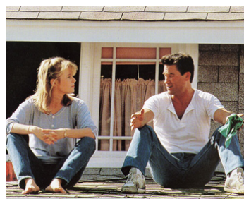
1991 BACKDRAFT (Backdraft) de Ron Howard avec Kurt Russell