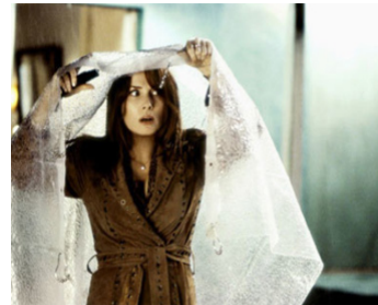
2003 IDENTITY (Identity) de James Mangold