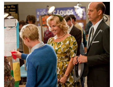
2010 UN CŒUR À L'ENVERS (Flipped) de Rob Reiner avec Anthony Edwards