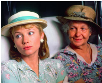
1985 MÉMOIRES DU TEXAS (The Trip to Bountiful) de P. Masterson avec Geraldine Page