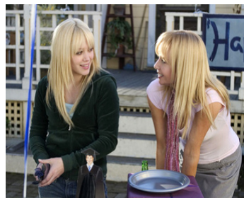
2006 TROUVE TA VOIX (Raise your Voice) de Sean McNamara avec Hilary Duff