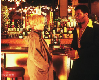
1999 COMME UN VOLEUR (Thick as Thieves) de Scott Sanders avec Gichi Gamba