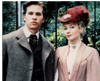
1986 LE TUEUR DE LA RUE MORGUE (Murder in the Rue Morgue) de J. Szwarc avec Val Kilmer