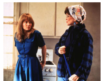
1994 AU BOUT DE LA NUIT (Range of Motion) de John Korty avec Ellen Burstyn