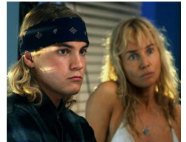
2005 LES SEIGNEURS DE DOGTOWN (Lords of Dogtown) de C. Hardwicke avec Heath Ledger