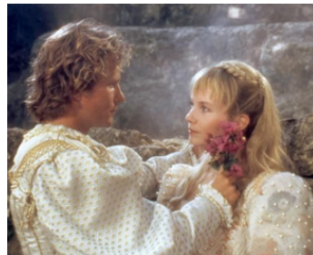
1987 LA BELLE ET LA BÊTE (Beauty and the Beast) d'Eugene Marner avec John Savage