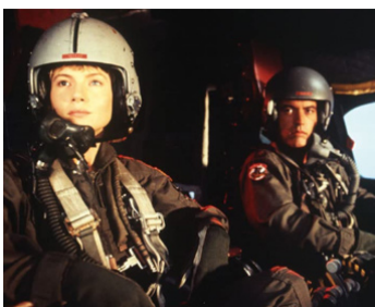
1990 L'AUBE DE L'APOCALYPSE (By Dawn's Early Light) de Jack Sholder avec Powers Boothe