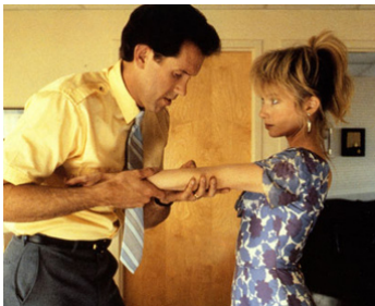
1988 AND GOD CREATED WOMAN de Roger Vadim avec Vincent Spano