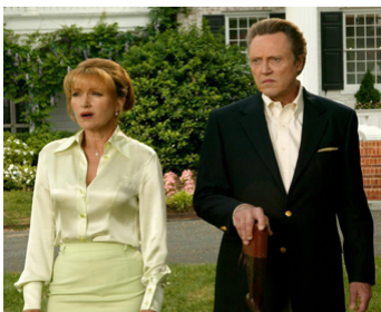
2005 SÉRIAL NOCEURS (Wedding Crashers) de David Dobkin avec Christopher Walken