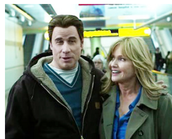
2016 THE REVENGE (I am Wrath) de Chuck Russell avec John Travolta