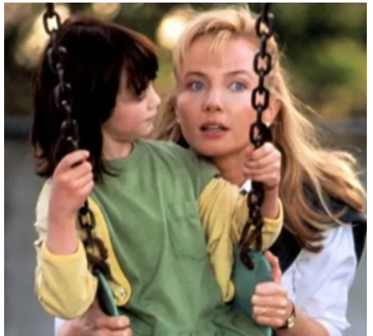
1992 LA MAIN SUR LE BERCEAU (The Hand that rocks the Cradle) de Curtis Hanson avec Madeline Zima