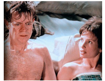
1998 BELLE ARNAQUEUSE (The Con) de Steven Schachter avec William H. Macy