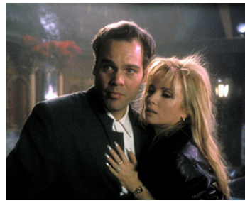
1996 LES FLAMBEURS (The Winner) d'Alex Cox avec Vincent D'Onofrio