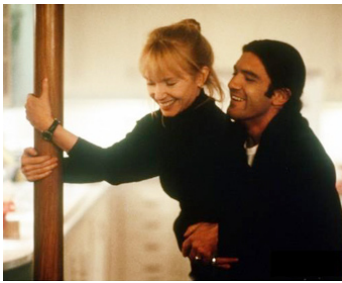
1995 EXCÈS DE CONFIANCE (Never talk to Strangers) de Peter Hall avec Antonio Banderas