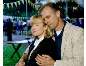
1999 L'AMOUR ÉGARÉ (Night Ride Home) de Glenn Jordan avec Keith Carradine