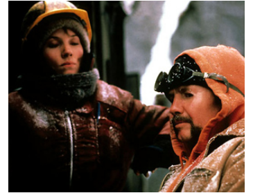
1985 À BOUT DE COURSE (Runaway Train) d'Andrei Konchalovsky avec Jon Voight