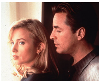
1993 L'AVOCAT DU DIABLE (Guilty as Sin) de Sidney Lumet avec Don Johnson